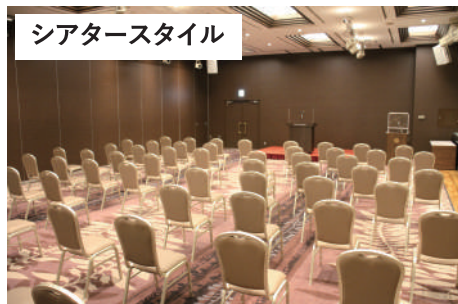
シアタースタイル