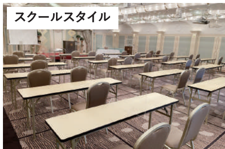
スクールスタイル